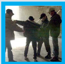
>>La Fondazione con la scuola contro il bullismo (I) Pagina 1