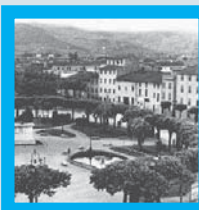
>>Bando 2006, i primi progetti che si realizzano (I) Pagina 3